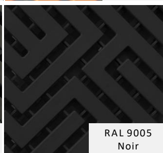
RAL 9005 Noir