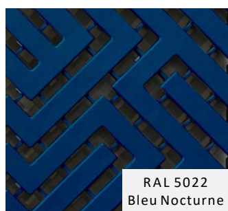
RAL 5022 Bleu Nocturne