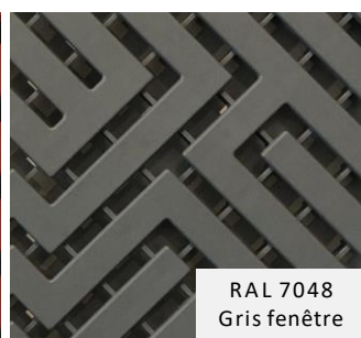
RAL 7048 Gris fenêtre