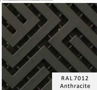
RAL 7012 Anthracite