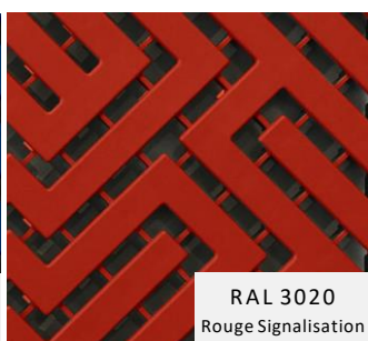
RAL 3020 Rouge Signalisation