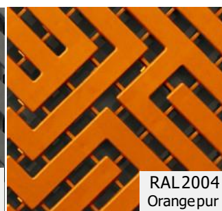
RAL 2004 Orange pur